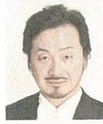
大海人皇子 花月 真