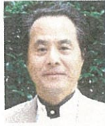
柿本人麻呂 尾形光雄