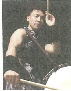
和太鼓 TAH たー