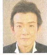
天智天皇 松岡重親